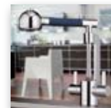
Abb. zeigt KLUDI ZIP

Küchenarmaturen für ein modernes, architekturbetontes Ambiente. Ob als Zweigriffarmatur oder als Einhandmischer