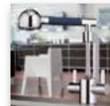
Abb. zeigt KLUDI ZIP

Küchenarmaturen für ein modernes, architekturbetontes Ambiente. Ob als Zweigriffarmatur oder als Einhandmischer